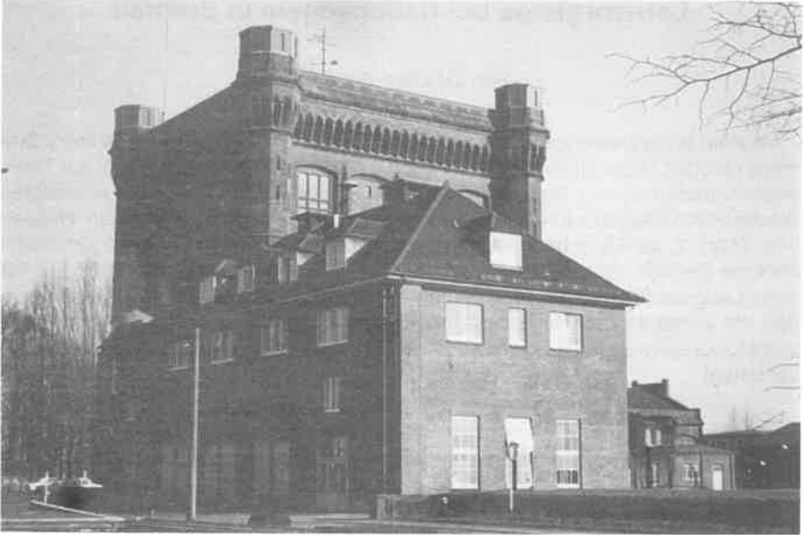
Abb. 2: Alter Wasserturm (Baujahr 1873) mit davorliegendem Betriebsgebäude des Wasserwerkes