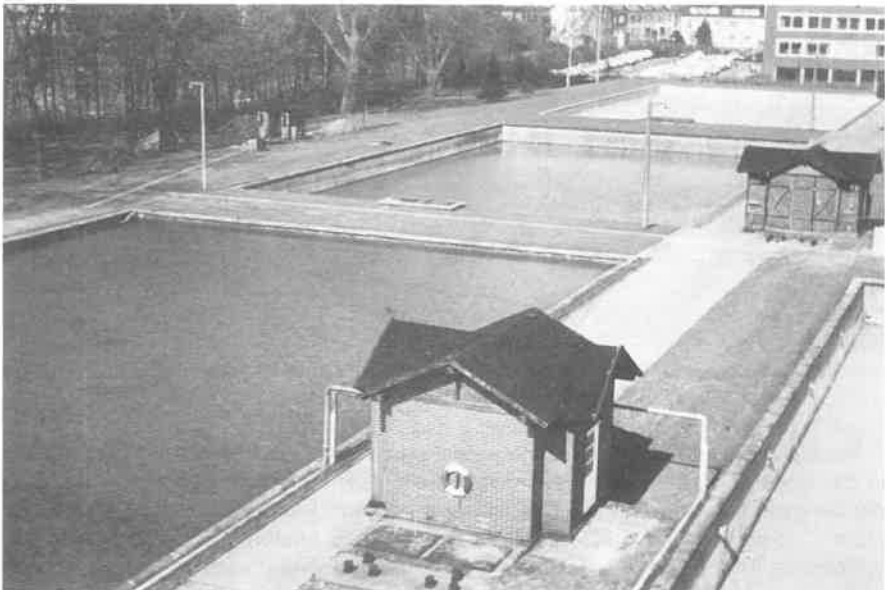
Abb. 3: Langsamfilterbecken mit Pumphäusern, Betonwegen und Wiesenstreifen