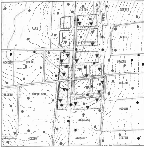
Abb. 3: Probefläche I - Verteilung der Reviere von Feldlerche ● und Wiesenpieper ▼ 1995.