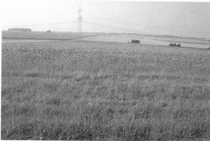
Abb. 2: Lindenberg (PF II).