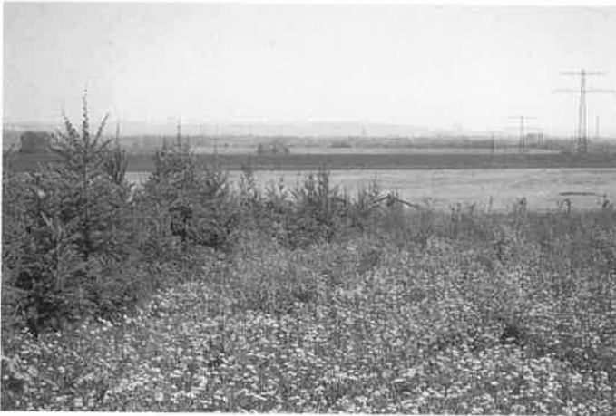
Abb. 1: Kronsberg (PF I).

West: Ackerland, Laubwald (18 ha) 1 km südwestlich.