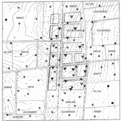
Abb. 4: Probefläche I - Verteilung der Reviere von Feldlerche ● und Wiesenpieper ▼ 1996.