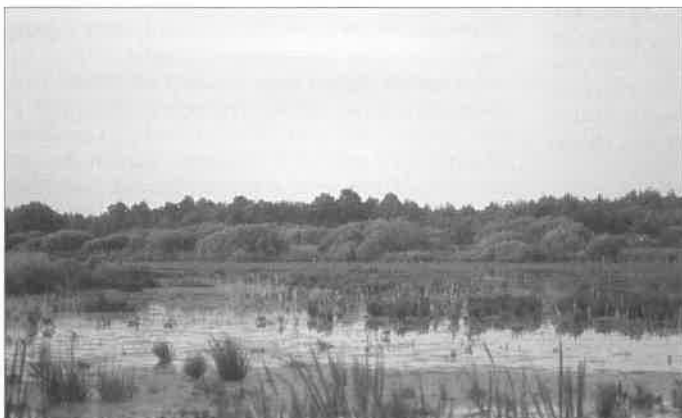
Abb. 3: Flachwasserbereiche im NSG Meerbruch. - Shallow water area in the nature reserve Meerbruch.

Nachtigall ( Luscinia megarhynchos ): Relativ häufiger Brutvogel mit schwankenden Beständen zwi-