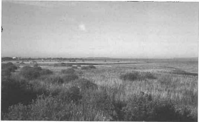
Abb. 2: Verlandungszone im NSG Ostufer Steinhuder Meer. - Reed-zone in the nature reserve Ostufer Steinhuder Meer.

erfolg des Brachvogels ist offensichtlich abhängig vom Predationsdruck. Im Feldmausgradationsjahr 1998 waren mindestens drei Bruten erfolgreich, in den trockenen und außerdem feldmausarmen Jahren 1996 und 1997 blieb der Bruterfolg aus oder war sehr gering (1996 kein Paar, 1997 nur ein Bp mit Jungvögeln). Wiederholt konnte festgestellt werden, dass einige Paare bereits im April das Gebiet wieder verlassen. Andere Brachvögel ziehen spät in das Gebiet ein (z.B. zwei beringte Vögel 1997). Die Fortpflanzungsrate im Gebiet liegt unter dem errechneten, zum Erhalt der Teilpopulation nötigen Wert (KIPP, mdl. Mitt.). Eine flexible Mahdnutzung der Wiesenflächen, basierend auf eine Nestersuche, hat zu Teilerfolgen geführt.