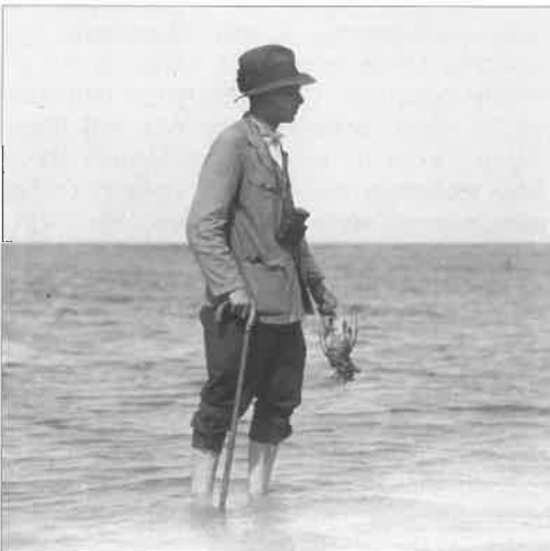
Als Vogelwart für den Verein Jordsand 1934 in Schleimünde.