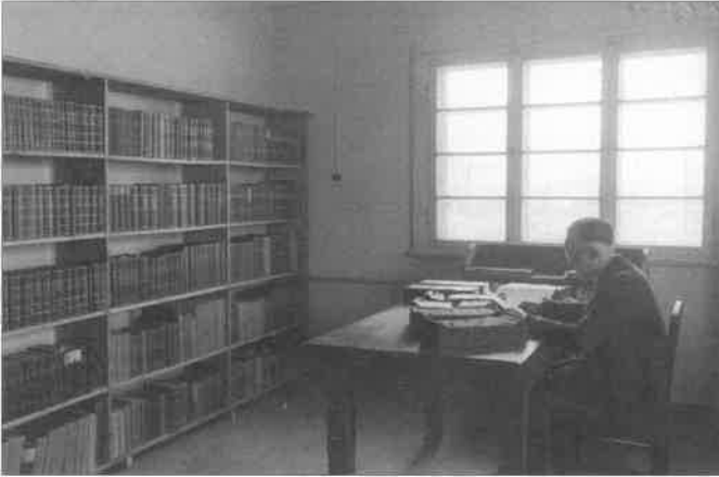
In der karg eingerichteten Bibliothek der Vogelwarte in Wilhelmshaven im Frühjahr 1948.

zu unternehmen. Große Tafelwerke oder besonders kostbare Raritäten des Büchermarktes konnte er sich freilich nicht leisten. Seine größte Anschaffung war die 12-bändige große Naumann-Ausgabe in Halbleder gebunden. Diese hatte er 1953 für 200 DM aus Privathand erstanden - für ihn damals eine ungeheure Summe. Er war zeitlebens stolz auf diesen Besitz.