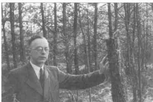
An der ersten auf der Kurischen Nehrung gefundenen Bruthöhle der Weidenmeise 1939