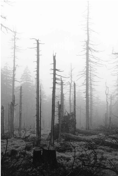
Abb. 3: Fichtenwald an etwa gleichem Standort wie Abb. 1, 1984. - Spruce forest approximately in the same place as Fig. 1, 1984.