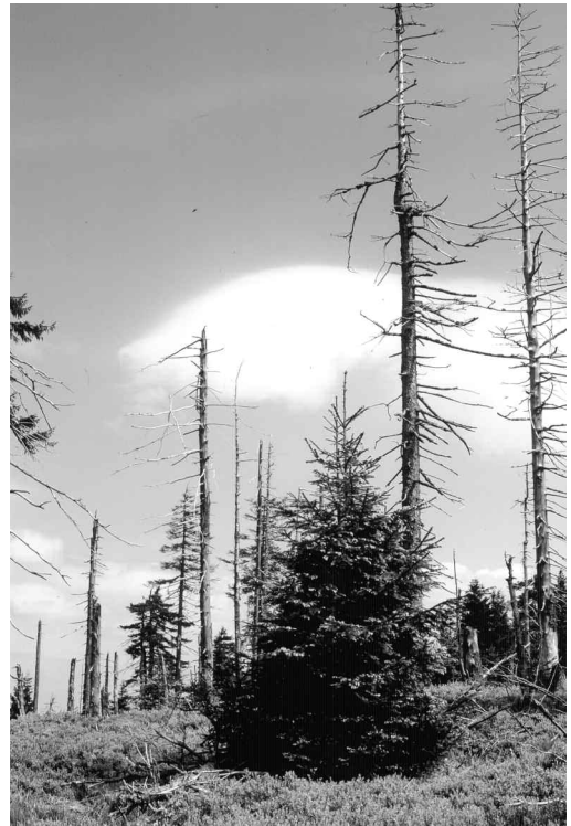
Abb. 4: Fichtenwald an etwa gleichem Standort wie Abb. 1, 2004. - Spruce forest approximately in the same place as Fig. 1, 2004.

war weder möglich noch unter Berücksichtigung der vorliegenden Zielsetzung notwendig. Die Begehungen im Hochharz erfolgten ursprünglich zur Kontrolle der Populationen des Wiesenpiepers und auf der Suche nach Vorkommen des Wasserpiepers. Immissionsschäden waren seinerzeit nicht voraussehbar. Daher wurden die Begehungen auch nur mindestens einmal, oft jedoch auch mehrfach jährlich zur Brutzeit durchgeführt. Erst nach Auftreten der Schäden wurden die vorhandenen Daten für Vergleichszwecke wertvoll. Die Erhebungen wurden durch dieselbe Person (Verfasser), zur selben Jahres- bzw. Brutzeit, bei vergleichbaren Wetterbedingungen und unter Bezug auf genau dieselben Flächen durchgeführt. Daher darf der Vergleich als genügend abgesichert gelten, soweit aus den Erhebungen Tendenzen des Einflusses der schädigenden Luftimmissionen ablesbar sind.