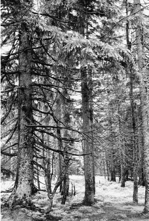
Abb. 1: Fichtenwald auf dem Bruchbergkamm zwischen Stieglitzeck und Skikreuz, 1979. - Spruce forest on the crest of "Bruchberg" between "Stieglitzeck" and "Skikreuz", 1979.