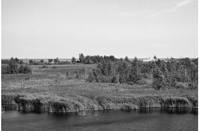
Abb. 4: Ausgedehnte Schilfröhrichte mit offenen Wasserflächen im Südtteil des Voslapper Grodens, Lebensraum der Rohrdommel. - Extensive reedbeds with pools in the southern part of the 'Voslapper Groden', habitat of the Bittern.

Inwieweit die Verfügbarkeit von Nahrung bei der Bestandsentwicklung eine Rolle spielt, ist mangels gezielter Untersuchungen ebenfalls nicht sicher zu beurteilen. Im Vorkommen im Südstrandpolder Norderney spielt möglicherweise der Rückgang der Fischpopulationen eine Rolle (M. TEMME briefl.). Am Dümmer kann es in einzelnen Jahren zu einem Nahrungsmangel aufgrund des Fehlens von Jungfischbeständen gekommen sein, Hauptproblem ist hier aber die mangelnde Nahrungsverfügbarkeit, da wasserdurchflutetes Schilf als Nahrungshabitat nur noch sehr eingeschränkt zur Verfügung steht (H. BELTING briefl.). Mangelnde Nahrungsverfügbarkeit wird auch für Röhrichte an der Unterweser vermutet (T. SCHIKORE, K. SCHRÖDER, E. JÄHME briefl.). In anderen Gebieten wie z. B. den Meißendorfer oder Habighorster Tei-