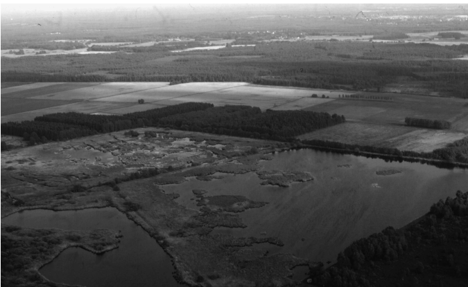
Abb. 3: Ausgedehnte, strukturreiche Schilfröhrichte im EU-Vogelschutzgebiet Meißendorfer Teiche werden von der Rohrdommel regelmäßig als Brutplatz genutzt. - The Bittern is breeding regularly in extensive, diversified reedbeds in the SPA 'Meißendorfer Teiche'.

Die Rohrdommel ist sowohl in den ungesicherten als auch den naturschutzrechtlich gesicherten Vorkommen verschiedenen Gefährdungen ausgesetzt. An möglichen aktuellen