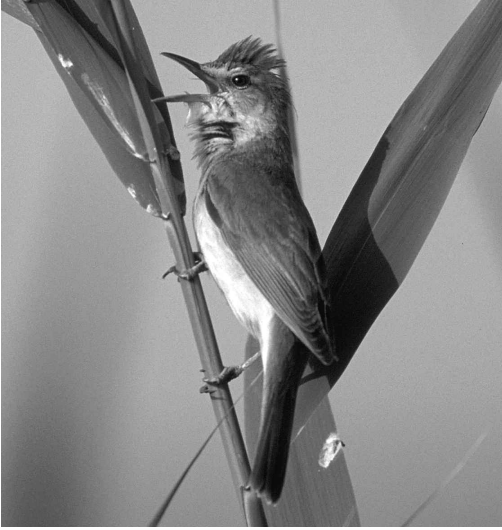
Abb. 3: Drosselrohrsänger Acrocephalus arundinaceus . Singt am liebsten auf Schilfhalmen, die mehr als 6,5 mm dick sind: Foto: Lutz Ritzel. - Great Read Warbler.

rohrsänger dürfte auch der Rohrschwirl Locustella luscinioides von den vorstehend beschriebenen Maßnahmen profitieren (REHSTEINER et al. 2004).