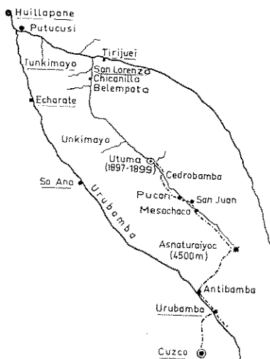
Abb. 2: Das Sammelgebiet Otto Garlepps in Peru 1897—1899. Nach einer Skizze in seinem Tagebuch (Maßstab: Cuzco-Utuma etwa 150 km).

südamerikanische Länder und bis zum Jahre 1913 fort. Zunächst war er mehrere Jahre in Peru tätig und sammelte hier allein bis zum August 1899 insgesamt 957 Vögel (die meisten heute im Senckenberg-Museum).