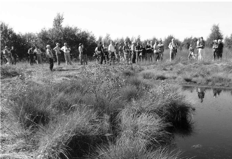
Exkursion in die Diepholzer Moorniederung.