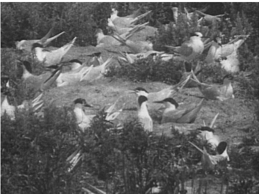
Brandseeschwalbenkolonie auf Mellum.