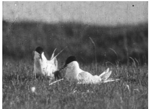
1923 brüteten auf Mellum 2.000 Paare Flussseeschwalben.