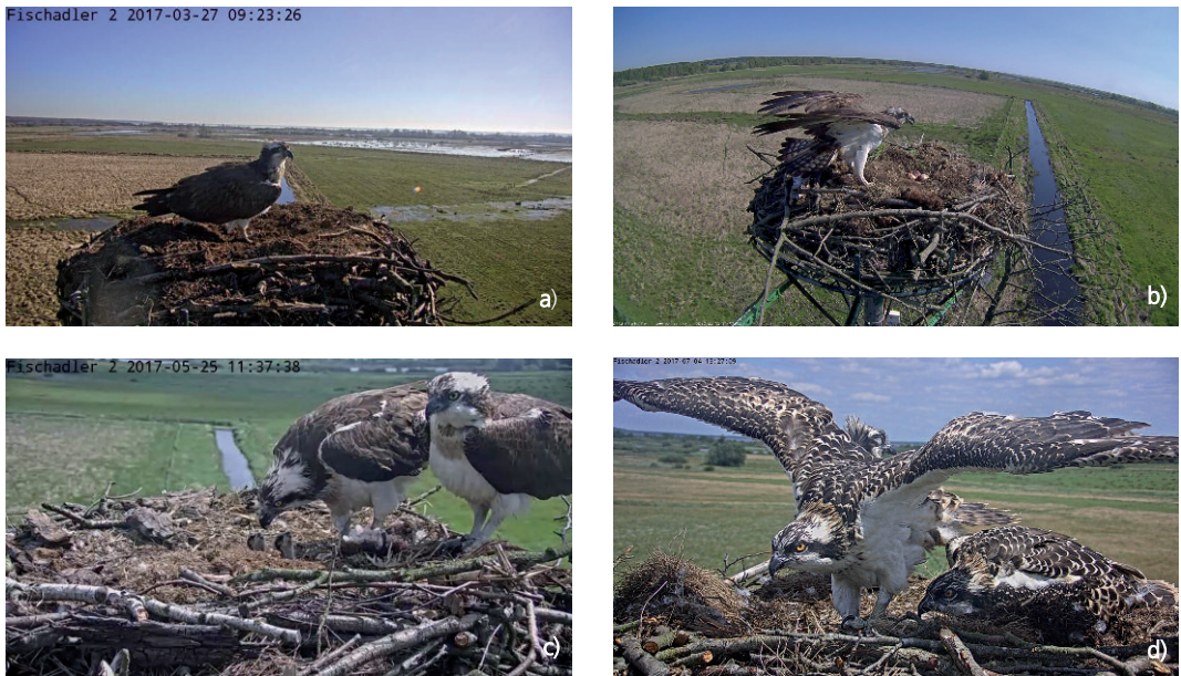
Abb. 1 (a): Dokumentierte Ankunft des Weibchens an einem kameraüberwachten Brutplatz auf einer Nisthilfe am Steinhuder Meer am 27. März 2017; (b) Weibchen mit Vollgelege am 30. April 2017, (c) zwei sechs bzw. vier Tage alte Jungvögel am 25. Mai 2017 und d) die selben Jungvögel am 04. Juli 2017, eine Woche vor dem erstmaligen Verlassen des Nestes. Fotos: Webcam ÖSSM. – a) Documented arrival of the female Osprey at an artificial nesting site at Lake Steinhuder Meer, 27 March 2017; b) full-sized clutch, 30 April 2017, c) two chicks, six respectively four days old, 25 Mai 2017 and d) the same juveniles, 4 July 2017, one week before leaving the nest. Photos taken by an automatic camera.

bedeutend, z. B. für einen effektiven Schutz von Brutplätzen. Gute Kenntnisse zur Biologie der streng geschützten Fischadler ermöglichen zielgenaue Schutzmaßnahmen, die Reglementierungen, z. B. bei der Waldbewirtschaftung, für die Nutzer in einem vertretbaren Rahmen halten. Aus diesem Grund werden hier die im Betrachtungsraum erhobenen Daten zum Legebeginn ausgewertet und die daraus abzuleitenden erforderlichen Schutzzeiten im Nestbereich vorgestellt.