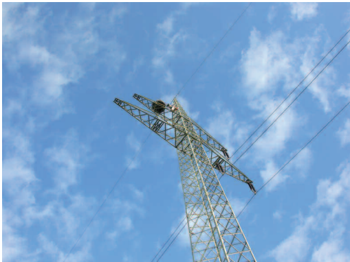
Abb. 2a: Nisthilfetyp 1 – Nesting platform type 1 .

Die 18 installierten und betreuten Fischadlernisthilfen sind aus Holz oder Metall und messen jeweils 1,2 m im Durchmesser. Die Nisthilfen sind auf verschiedene Träger gebaut und lassen sich, auch wenn es sich oftmals um jeweils an die speziellen Bedingungen angepasste Unikate handelt, folgenden