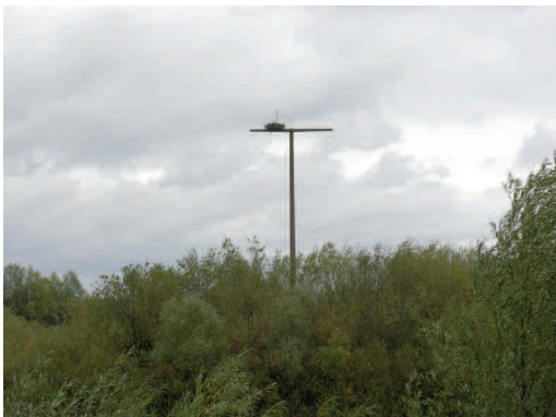
Abb. 2c: Nisthilfetyp 3 – Nesting platform type 3 .