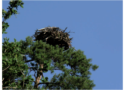
Abb. 2b: Nisthilfetyp 2 – Nesting platform type 2 .