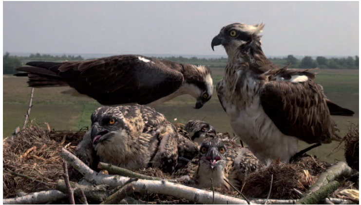
Abb. 4: Bruterfolg auf einer Nisthilfe im NSG Meerbruchswiesen 2015. Foto: Automatische Kameraaufnahme). – Breeding success on an artificial nesting platform in the nature protection area „Meerbruchswiesen“ west of Lake Steinhuder Meer in 2015. The photo was made by an automatic camera.

Insgesamt flogen im Untersuchungsgebiet von 2006 bis 2015 aus 23 begonnenen bzw. 19 erfolgreichen Brutten 54 Fischadler aus (Abb. 3). Die Jungvögel stammen aus 16 Brutten mit drei sowie drei Brutten mit jeweils zwei Jungvögeln. Mindestens zwei Jungvögel einer Brut kamen vor dem Ausfliegen ums Leben (2013 auf einem Nest auf einem Strommasten, Ursache unbekannt), und zwei Mal wurde ein Gelege aufgegeben (2012 und 2013). Beim Brutverlust 2015 war nicht zu klären, ob sich bereits Jungvögel im Nest befanden. Insgesamt ergibt sich demnach eine Fortpflanzungsziffer von 2,35 Jungvögel/begonnene Brut ( n = 23 ) und eine Brutgröße von 2,84 flügge Juv./erfolgreichem Brutpaar ( n=19 ).