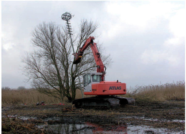
Abb. 5: Bau einer 12 m hohen Nisthilfe (Typ 4 – ÖSSM Model) am Ostufer des Steinhuder Meeres. Foto: Thomas Brandt. – Construction of a 12 m high pylon with nesting-platform on the eastern bank of Lake Steinhuder Meer.

Alle Fischadler im Untersuchungsgebiet brüteten auf Nisthilfen. Aufgrund der geringen Brutpaar- und Brutplatzzahl sowie der Tatsache, dass ein