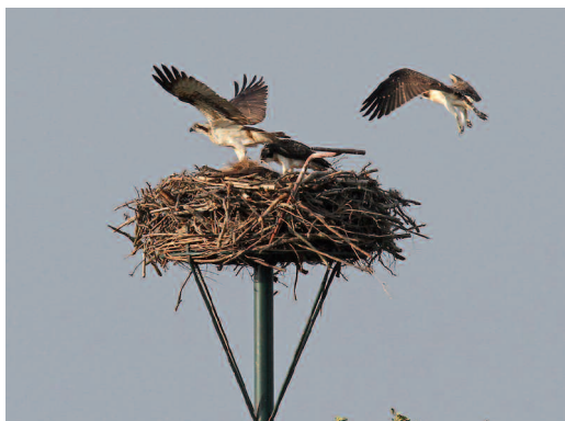
Abb. 1. Fischadler brüten seit 2006 am niedersächsischen Steinhuder Meer. Im Bild eine Brut im NSG Meerbruchswiesen 2011. – Ospreys have bred at Lake Steinhuder Meer, Lower Saxony, since 2006. On the photo : Successful brood in the nature reserve „Meerbruchswiesen“ in 2011.

außerdem angrenzende potenzielle Sichthindernisse überragt. Derartige Brutmöglichkeiten sind heute in typischen Forsten mit meist altersgleichen Baumbeständen kaum noch zu finden. In der offenen Landschaft stehen geeignete Bäume meist an Wegen und kommen verständlicherweise aufgrund der vielen Störreize als Brutplatz kaum in Frage.