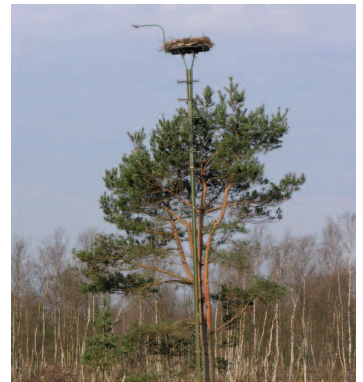
Abb. 2d: Nisthilfetyp 4 – Nesting platform type 4 .

Abb. 2 a-d: Beispiele von unterschiedlichen Nisthilfetypen. Nisthilfe auf Strommast (Typ 1), auf Betonmast (Typ 3) und auf im Baum eingebaute Metallkonstruktion (Typ 4). Fotos: Thomas Brandt. – Examples of four different types of artificial nesting platforms. Power pylon (type 1), tree (type 2), concrete pylon of a former power supply line (type 3) and special tree-metal pylon construction (type 4).