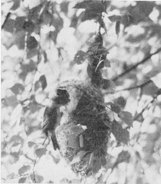
Abb. 1. Das ♀ am Nest. An der weißflockigen Einflogröhre ist deutlich zu erkennen, daß Pappel- und Weidensamen mit verbaut wurden.

Als Nistmaterial wurden neben Grashalmen, Tierhaaren und Spinnweben auch Samenhaare von Pappeln und Weiden mit verbaut. Die Samenhaare haben keine bestimmte bautechnische Funktion, sondern sind zur Zeit der Reife durch Zufall mit verwandt worden. So fiel beim Brutnest der Bau